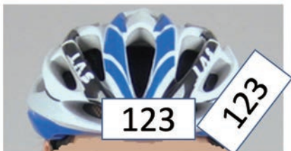
正面と左側に貼ってください