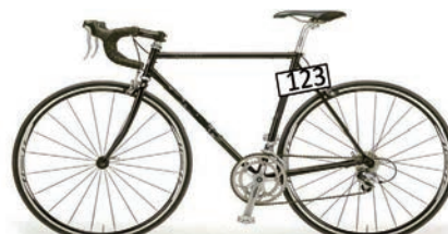
サドル下の両側に貼ってください